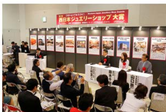
2017年5月に神戸国際宝飾展で実施された「西日本ジュエリーショップ大賞」表彰式

年末・クリスマス商戦にぴったりのジュエリー・素材がお得に仕入れられるのはもちろん、これからのビジネスに役立つノウハウを学べ、また今話題の女性芸能人によってジュエリーの魅力を堪能できる秋のIJT。ぜひ10月末には「宝石が似合う街 横浜」で、貴社のビジネスを活性化させる商品とノウハウを手に入れよう。